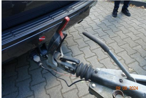
Zdj cie 17