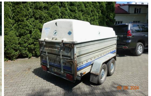
Zdj cie 06