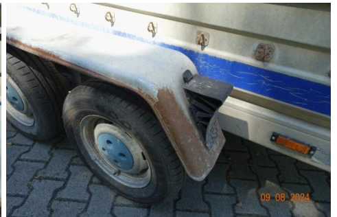
Zdj cie 21