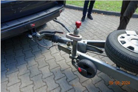
Zdj cie 16