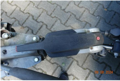
Zdj cie 13