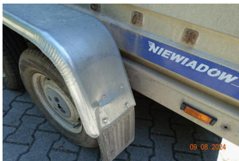
Zdj cie 23