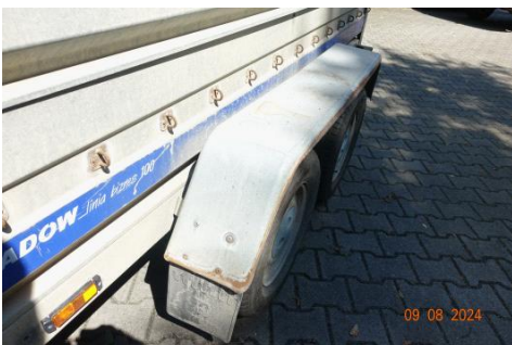
Zdj cie 22