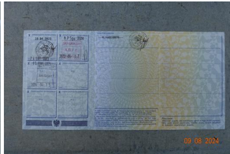
Zdj cie 02