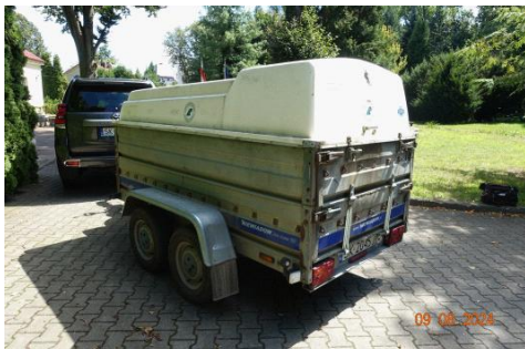
Zdj cie 04