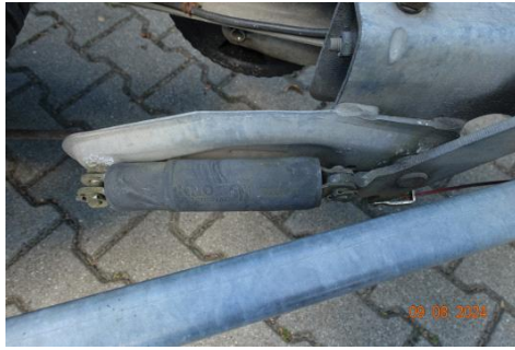
Zdj cie 14