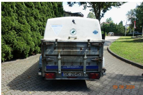
Zdj cie 07