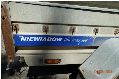
Zdj cie 20