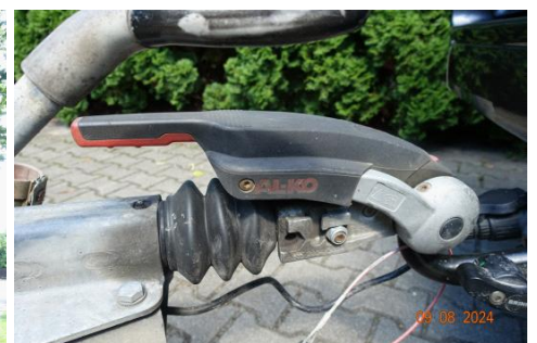
Zdj cie 12