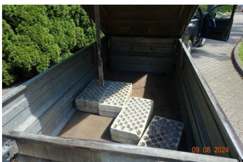
Zdj cie 10