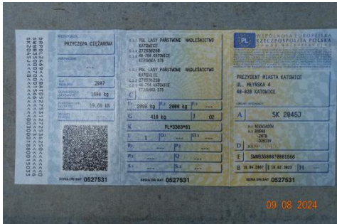
Zdj cie 01