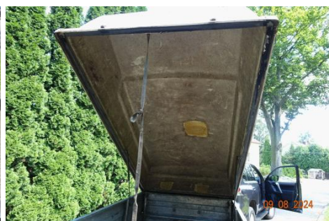
Zdj cie 11