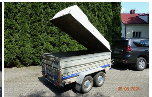
Zdj cie 09