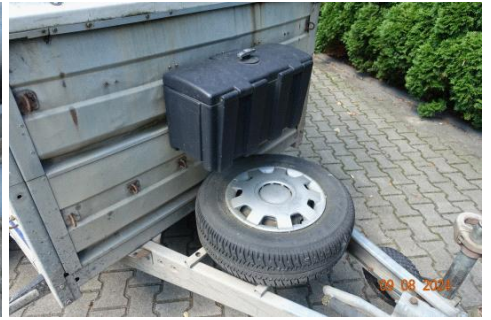
Zdj cie 15