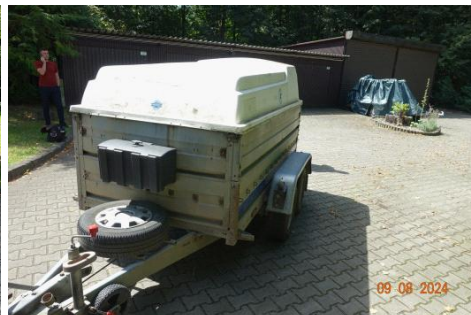
Zdj cie 05