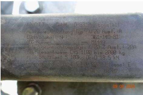
Zdj cie 19