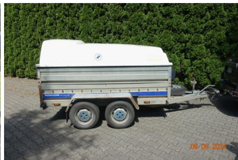
Zdj cie 08