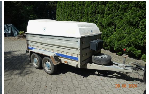
Zdj cie 03